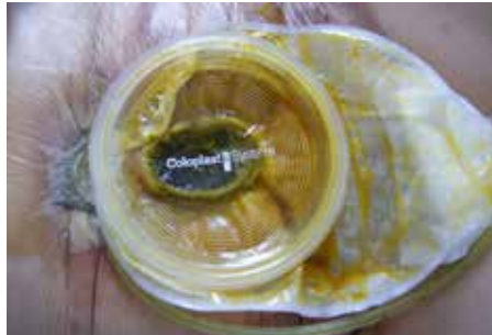
Abb. 3: Vollständiger Verband mit Saugung und Stoma-Set