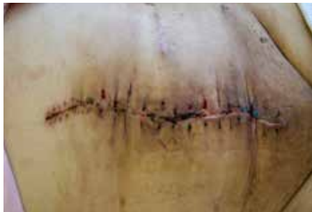
Abb. 6: Wunde nach abschließender Revisionsoperation fünf Monate später

über der Fistel befinden und diese komplett ausparieren. Der PU-Schwamm sollte keinen direkten Kontakt zum Darpaket haben.