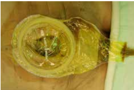
Abb. 5: Stomaversorgung nach Abschluss der Vakuumtherapie