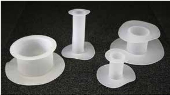
Abb. 1: Verschiedene Varianten des Fisteladapters

systemen, Klebe- und Nahttechniken sowie Defektdeckungen sind beschrieben. Einfache und verlässliche Behandlungsoptionen fehlen jedoch weiterhin. 5