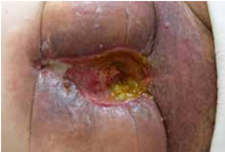
Abb. 2: Multiple Dünndarmfisteln bei Frozen Abdomen und schwer geschädigter Haut